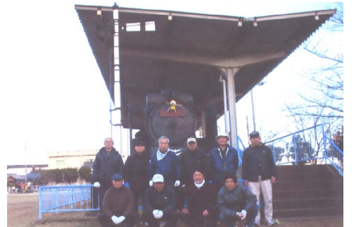
h24.12.24 清掃活動(坂出分会)