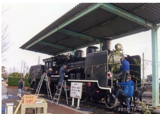
上段:現姿 h24.12.25 保存当時 s45.10(駅前広場に展示)