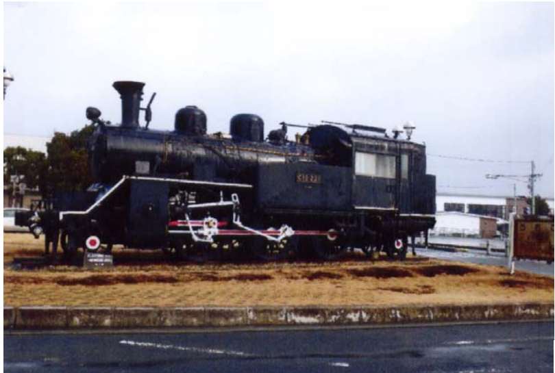
上段: 現姿 h25.1.17